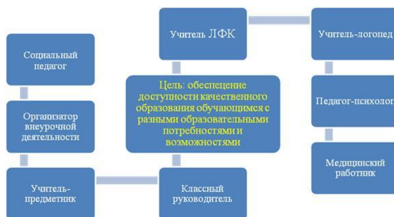
Схема комплексного психолого-медико-педагогического сопровождения детей с ОВЗ

Согласно действующей модели коррекционно-развивающей системы в нашем образовательном учреждении, слаженной работе коллег, создании и реализации их авторских программ удаётся своевременно и качественно помочь обучающимся с особыми образовательными потребностями развить уверенность в своих возможностях, а главное достичь им хороших результатов в разных областях. Это не только важно для нас, но и для дальнейшего личностного роста ребёнка, который в результате проведенных мероприятий проявил свою одаренность (ребята участвуют во всевозможных мероприятиях, принимают участие в конкурсах, становятся конкурентоспособными).